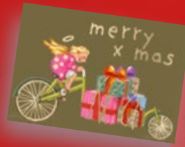
Happy x-mas Mini-Doppelkarte