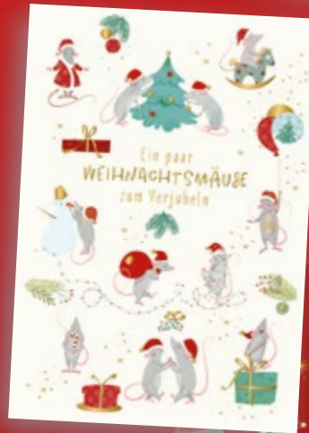
Friends x-mas Doppelkarte