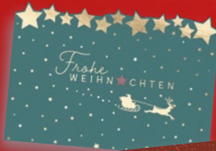
Happy x-mas Postkarte