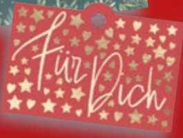
Happy x-mas Geschenkanhänger